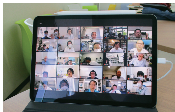
学内でのFD・SD研修会 On-campus FD・SD Seminar

The Active Learning Education Center is working on wide variety of faculty development (FD) and staff development (SD) activities, such as building appropriate class atmosphere, assessing various teaching techniques and skills, administering class observations, and holding workshops and seminars for education improvement. Also, the center is making effort to promote various forms of active learning on campus, such as arranging environment which enables education using ICT with cooperation with the Information Processing Center. *For activities done in academic year 2022, see "Activities for Educational Improvement and Staff Development" on page 35.